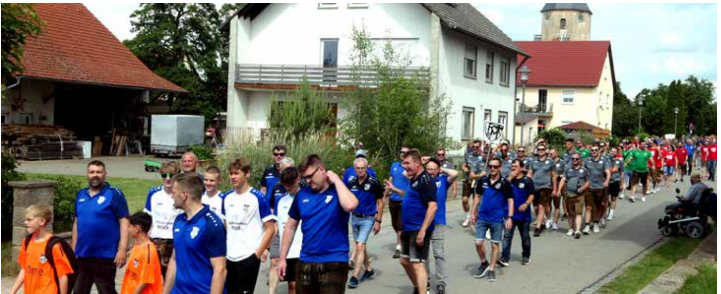
Kirchweihumzug in Röttenbach 2024: sichtbares Zeichen des Zusammenhalts in der Gemeinde

Warum lohnt es sich mitzumachen? Mit dem Forschungsvorhaben werden für Bürger und Politik Erkenntnisse über die Verbundenheit in den ländlichen Regionen erarbeitet, systematisiert und vergleichend ausgewertet. So kann der soziale Zusammenhalt besser sichtbar gemacht und weiterentwickelt werden. Die Ergebnisse werden laufend auf der Projektwebsite zur Verfügung gestellt, so dass alle Interessierten sich selbst ein Bild machen können. Der Ergebnisbericht aus der ersten Bürgerbefragung sowie eine Ergebnisbroschüre aus dem ersten Vertiefungsprojekt zum Thema Alltagsunterstützung für Senioren durch Nachbarschaftshilfen können bereits online eingesehen werden. Eine Abschlussveranstaltung mit dem Bay. StMFH zum Projektende bietet die Möglich